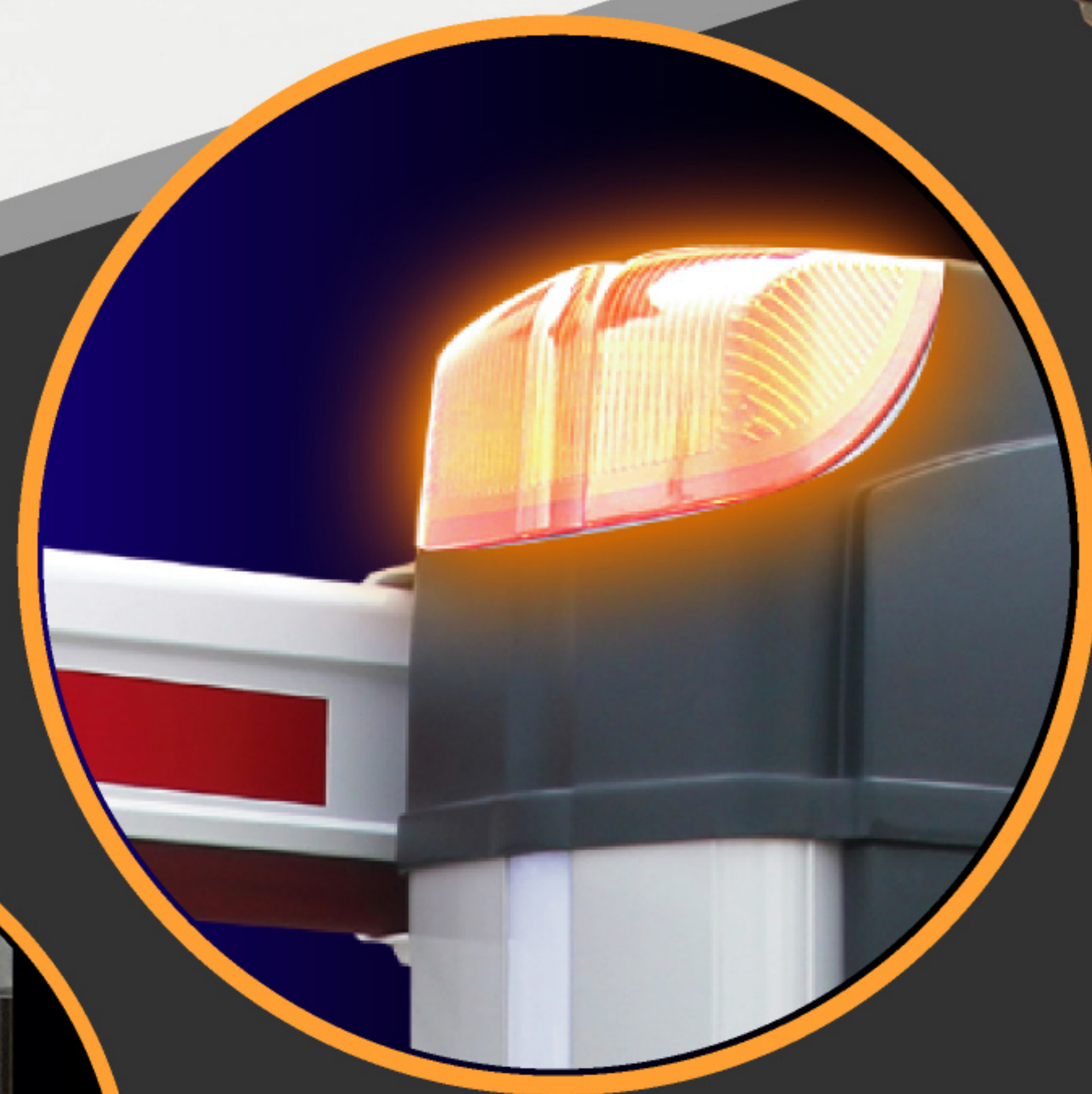
LED Caution Light

ท่านสามารถมั่นใจได้ เนื่องจากสินค้าได้มีการทดสอบมากกว่า 350 ล้านครั้งแล้วจะสามารถทำงานได้เป็นอย่างดี มีระบบการตั้งไม้กลับเมื่อไม้กั้นได้กระทบโดนวัตถุที่ขวางอยู่ เพื่อป้องกันหรือลดความเสียหายที่จะเกิดขึ้นได้ อีกทั้งยังสามารถปรับหมุนมอเตอร์แบบ Manual ในกรณีเกิดเหตุฉุกเฉินหรือไฟฟ้ามดับ พร้อมสามารถปรับระดับไม้กั้นตามตำแหน่งที่ต้องการได้