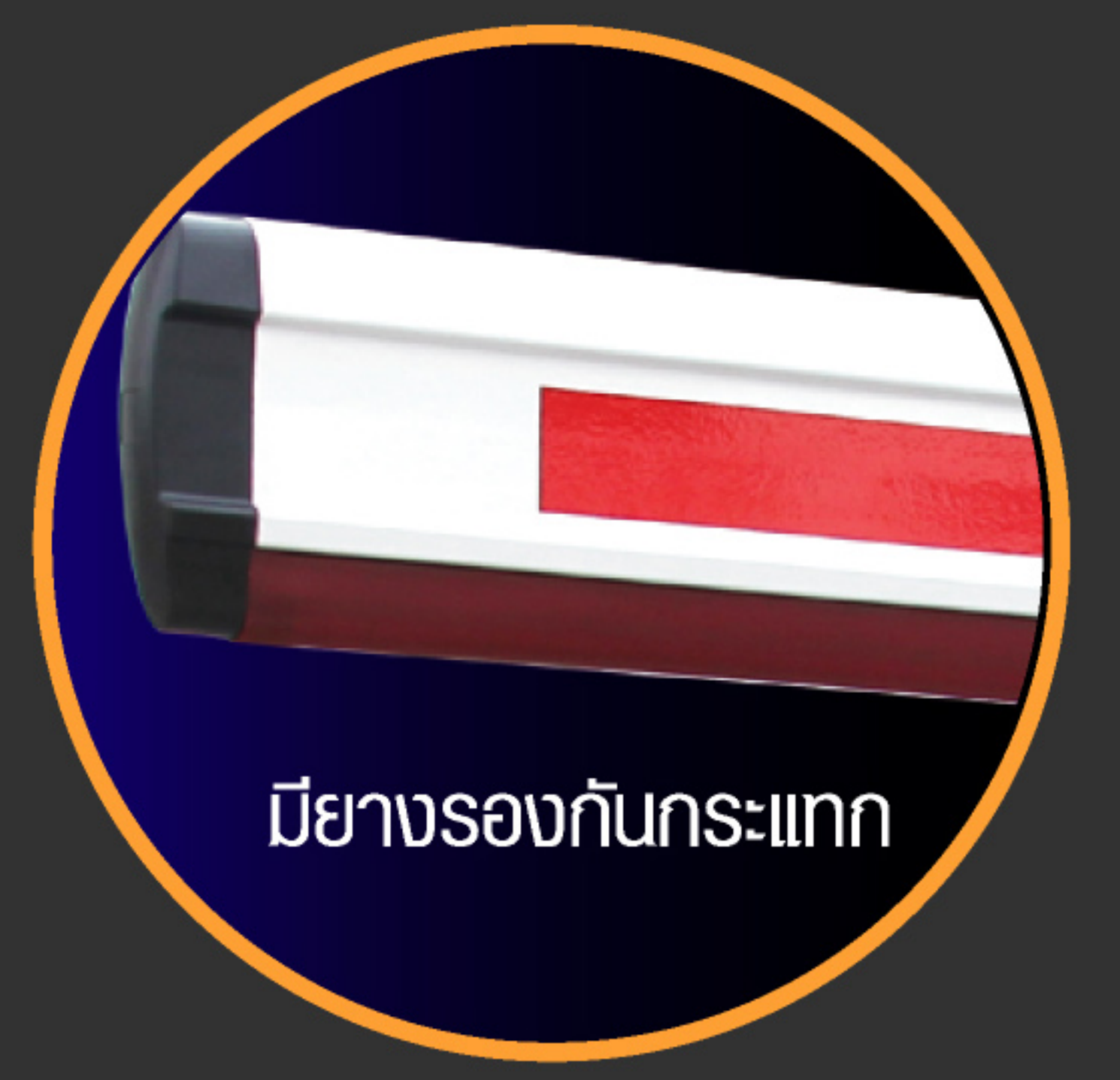
มียางรองกันกระแทก